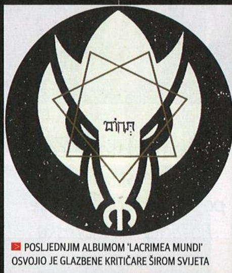
► POSLEDNJIM ALBUMOM 'LACRIMEA MUNDI' OSVOJIO JE GLAZBENE KRITIČARE ŠIROM SVIJETA

Od kad je treći album izašao u svibnju 2014., sve se dosta otvorilo. Odlične recenzije su dolazile jedna za drugom sa svih strana svijeta. Usporedo s tim imao sam intervju u nekoliko internet magazina i blogzina, a ponosan sam i na nekoliko intervjua u tiskanim magazinima, primjerice u časopisima